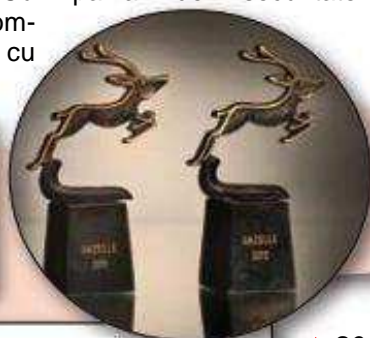
Premiile Børsen Gazelle

Menționând doar țările vecine, aproape în fiecare an, atât producătorul cât și produsele au fost premiate. ▶ 2008. Premiul pentru compania de securitate a anului, Italia. ▶ 2011. Premiul pentru compania de securitate a anului, Danemarca.